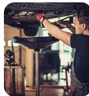
Huiles minérales usagées (issues de moteurs à combustion interne)