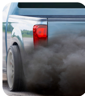
Emissions d'échappement de moteurs Diesel