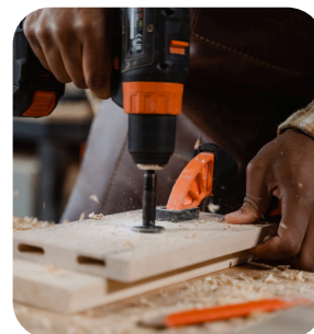
Poussières de bois inhalables