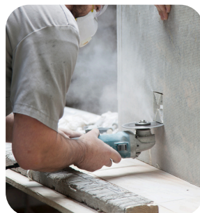
Poussières de silice cristalline alvéolaire

Retrouvez la liste complète sur www.legifrance.gouv.fr (arrêté du 26 octobre 2020 modifié par l'arrêté du 03 mai 2021)